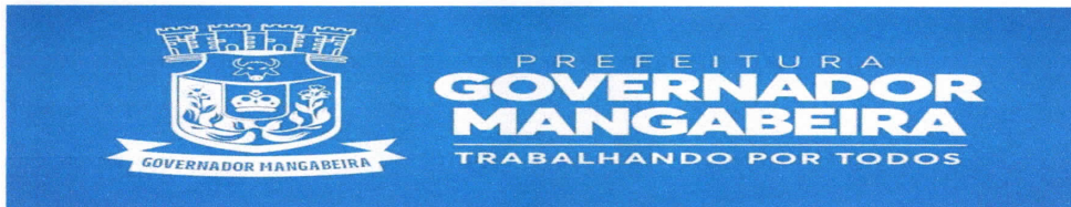
TABELA – III ANEXA AO DECRETO Nº054/2022 ESPAÇOS PÚBLICOS – PRAÇAS E LOGRADOUROS DA SEDE