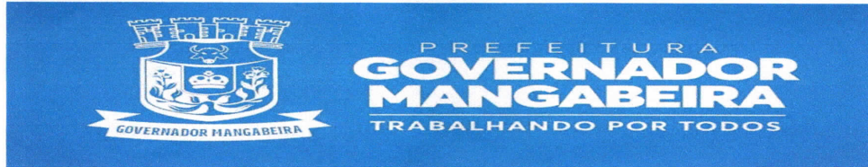
TABELA ÚNICA ANEXO AO DECRETO Nº 054/2022