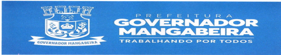
TABELA – I