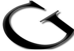
Glauco Mendes Advogados Associados