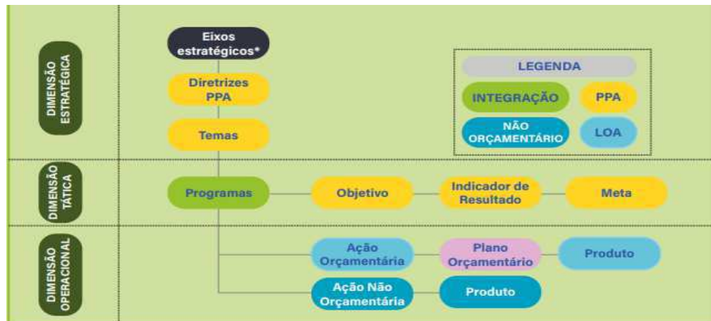
Figura 1: Modelo Referência do PPA Federal

Tais inovações estão voltadas para o resgate da função planejamento, para a utilização de uma linguagem capaz de melhorar a comunicação dentro e fora do Governo e para o fortalecimento da dimensão estratégica do Plano, criando as condições necessárias para a gestão e implementação das políticas públicas na perspectiva municipal.