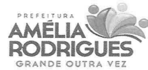
TABELA DE RECEITA ANEXA À LEI Nº 010/2018. IMPOSTO SOBRE SERVIÇOS DE QUALQUER NATUREZA - ISS