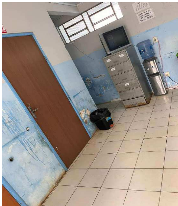
Figura 06 – RECEPÇÃO / CONSULTÓRIO MÉDICO