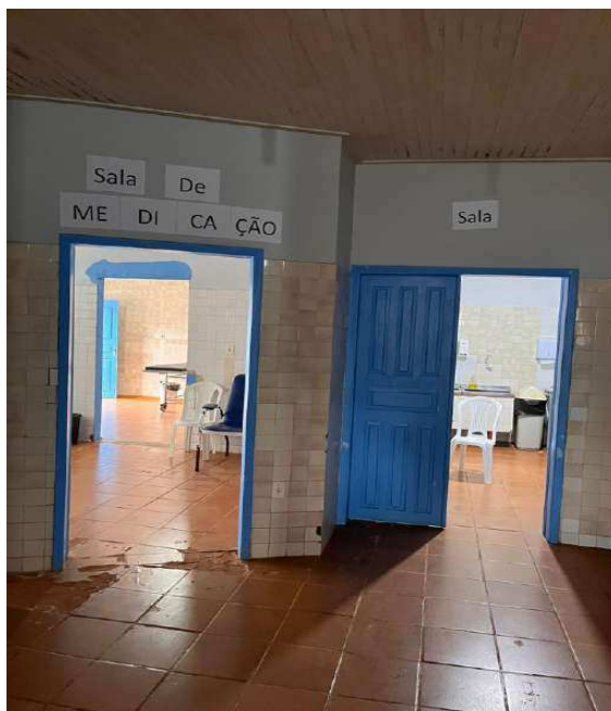
Figura 08 – ÁREA DE CIRCULAÇÃO INTERNA