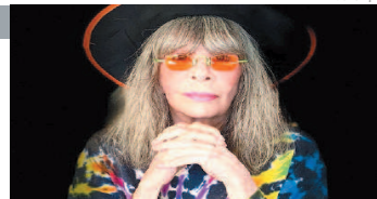
Cantora morreu aos 75 anos no último dia 8

O presidente do júri do festival é o sueco Ruben Östlund, que venceu a Palma de Ouro no ano passado por Triângulo da Tristeza.